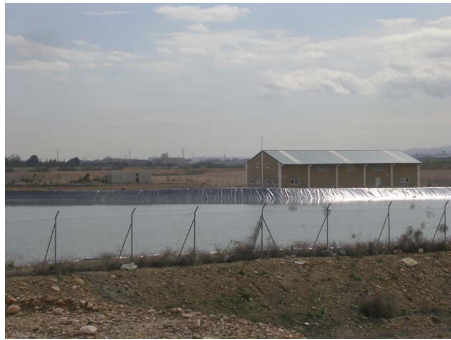
FOTO 17: NAVE JUNTO A LA Balsa (FUERA DEL ÁMBITO DEL PLAN ESPECIAL)