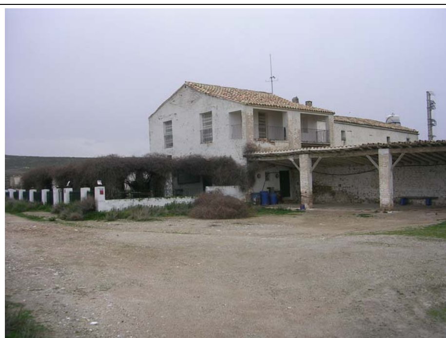
FOTO 76: CASA DE GRANDES DIMENSIONES (ACAMPO ACOSTA) CON EXPLOTACIÓN GANADERA SIN USO